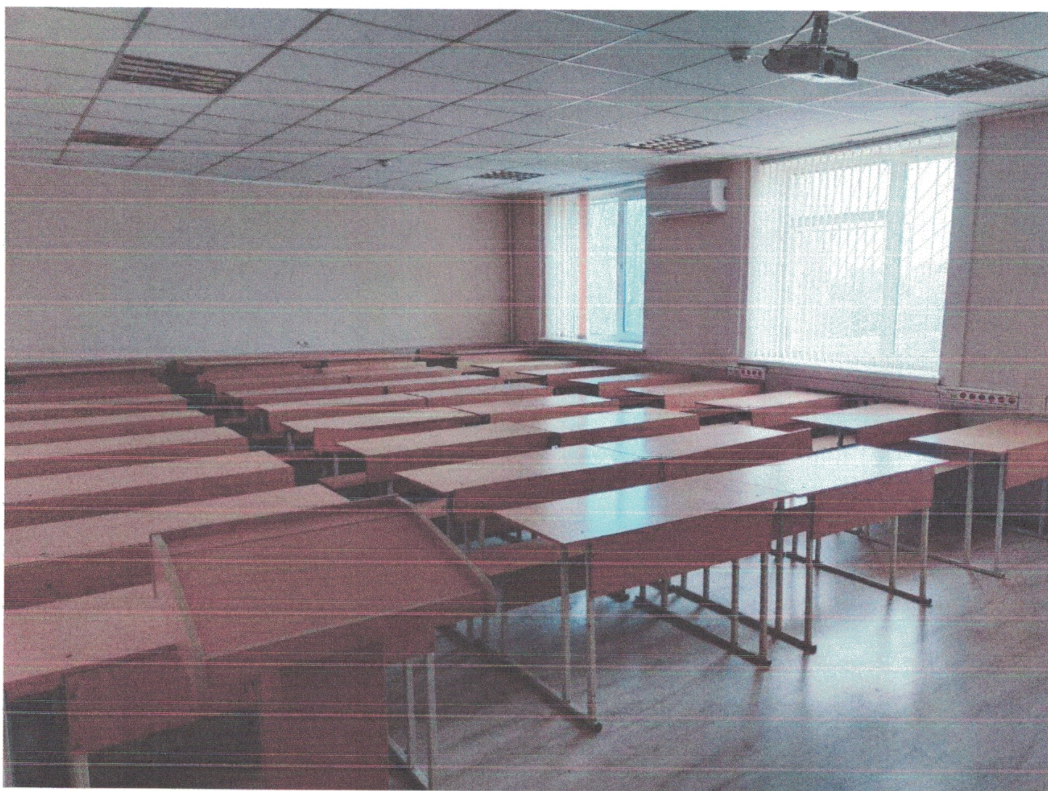
ФОТО КАБІНЕТУ 462